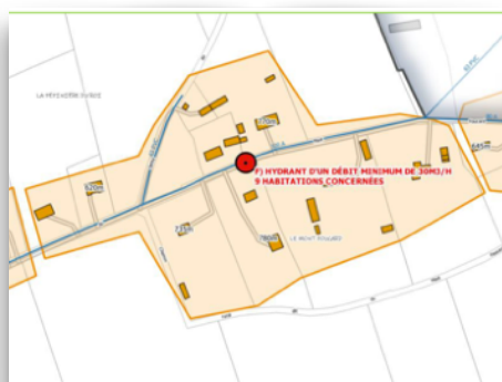
N°531 de la rue du Mont-Foucard