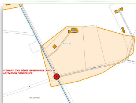
Croisement de la rue du Plessis et de la sente des jardins

Courant 2023, 3 nouvelles bornes à incendie seront installées rue du Plessis, du Mont-Foucard et de la Marotte.