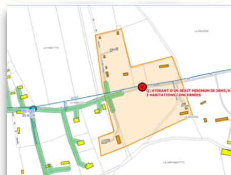
Entre le n°540 et le n°690 de la rue de la Marotte

Les demandes de subventions ont été accordées à hauteur de 2958€ par la DETR, 3451€ par le département. Le reste à charge pour la commune est de 3452€.